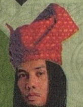
DYMM Almarhum Sultan Abdullah AlMu'tasim Billah Shah, 1932