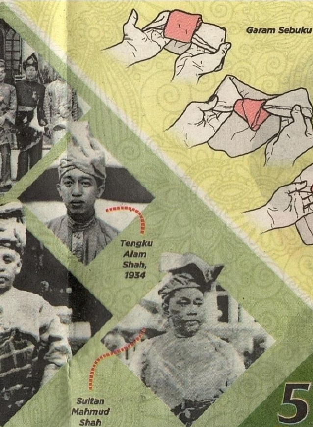
Tengku Alam Shah, 1934